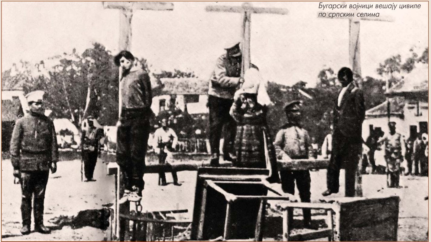
Бугарски војници вешају цивиле по српским селима