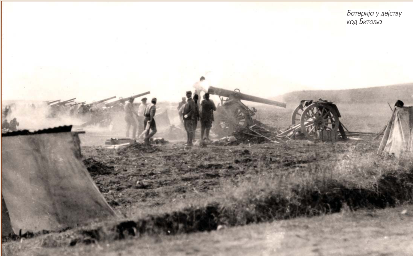
Батерија у дејству код Битоља