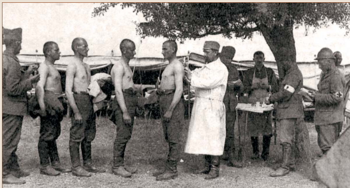
Вакцинисање српских војника против колере и тифуса на Крфу 1916. године