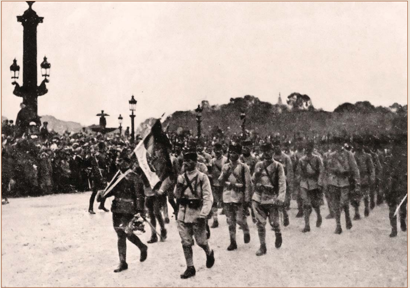
Дефиле српских трупа на Plas de la Konkord у Паризу 14. јула 1918. године поводом савезничке победе у Првом светском рату

га је крајем 1916. године наступило затишје на целом фронту. Наступио је дуги период "рововске војне". Карактеристика тог раздобља рата је "савезничка неверица" да Солунски фронт може произвести "више користи, него главобоље", каже М. Екмеџић. Наиме, поново су политичке калкулације претиле да потамне славу и жртве војника. Скоро у свим владама зараћених држава постоје министри којима је досадило "мрцварење по рововима" и генерали који су процењивали да је "рат готово добијен". Умножавају се идеје о миру, укључујући ту и покушаје појединих држава да одмах отпочну преговори о миру. Такви предлози су карактеристични за Аустроугарску и Немачку.