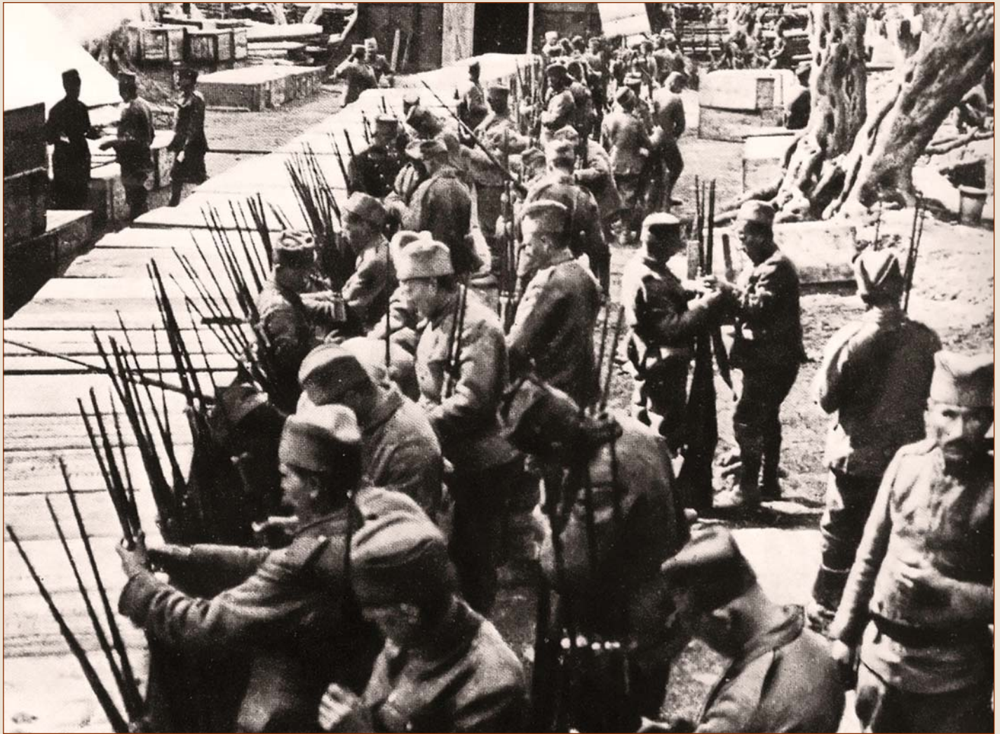
Наоружавање Српске војске пред полазак на Солунски фронт

И транспорт Српске војске са Крфа у Солун организовала је Француска. Пет француских помоћних крстарица обавило је 15 путовања, а остатак закупљени бродови и два италијанска пловила. Превожење главнине отпочело је 18. априла. Прво је превезена Прва армија, а онда друге две и Коњичка дивизија, са којом је 17. маја и завршено пребацивање око 127.000 српских војника и официра, који су прикупљени на Халкидици.