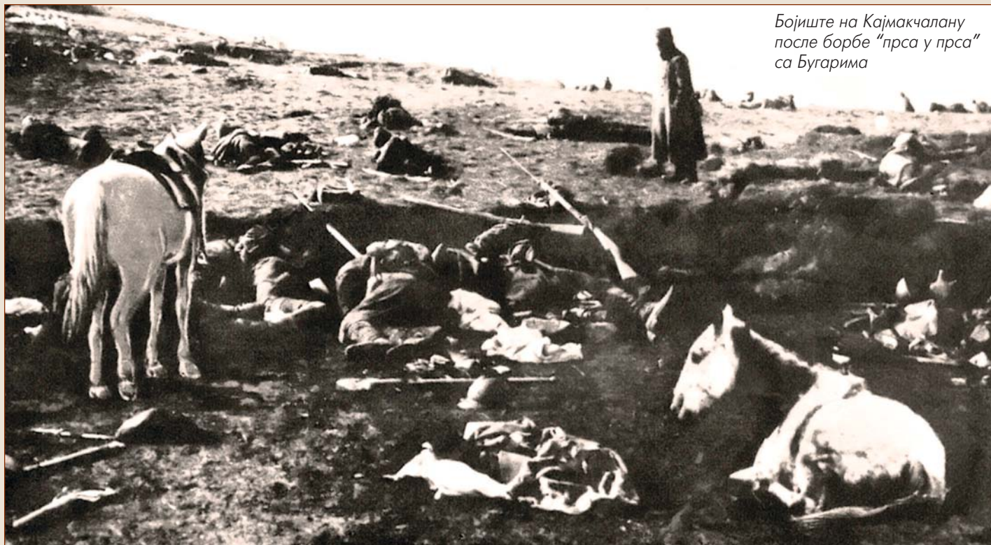
Бојиште на Кајмакчалану после борбе "прса у прса" са Бугарима