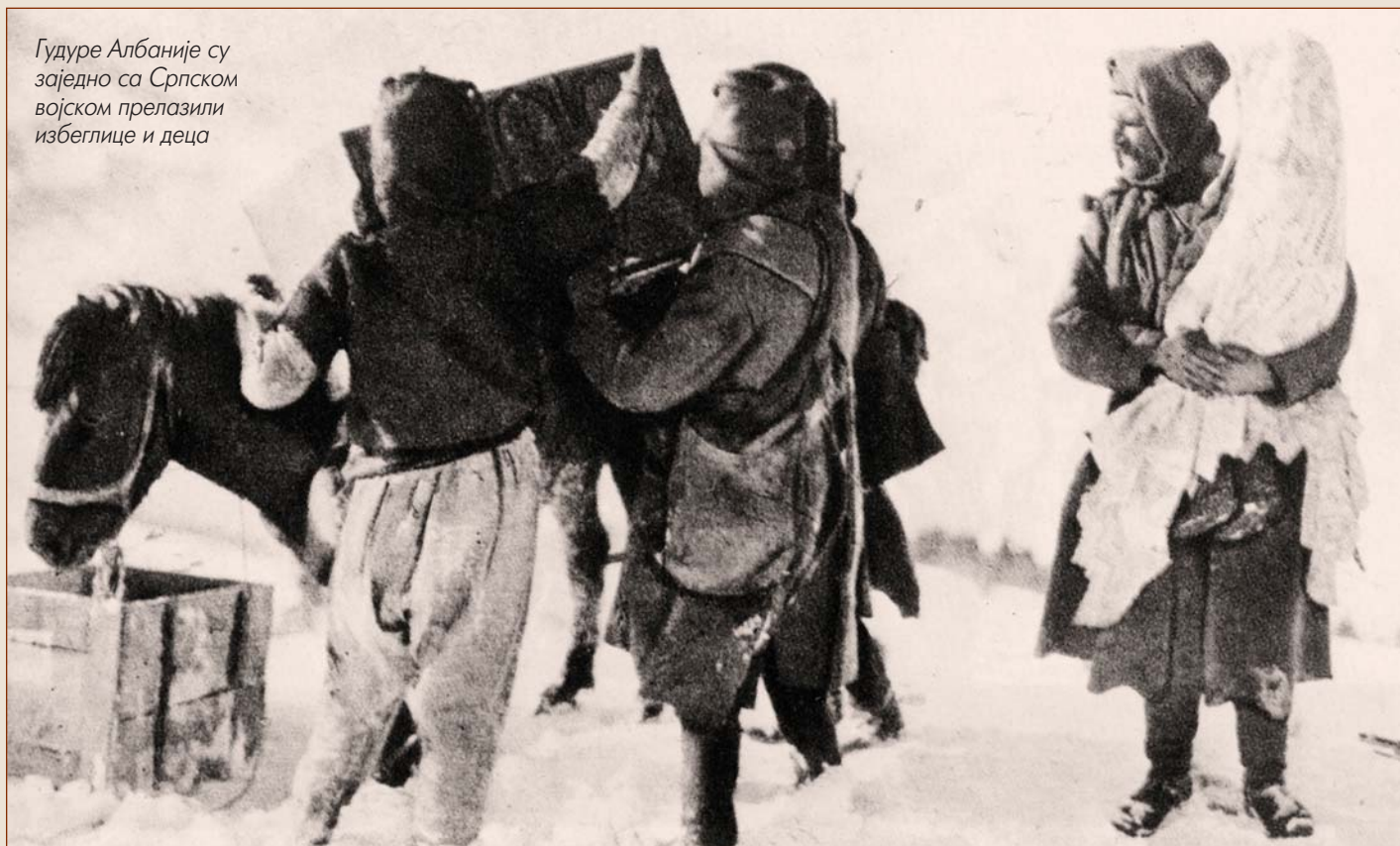
Гудуре Албаније су заједно са Српском војском прелазили избеглице и деца