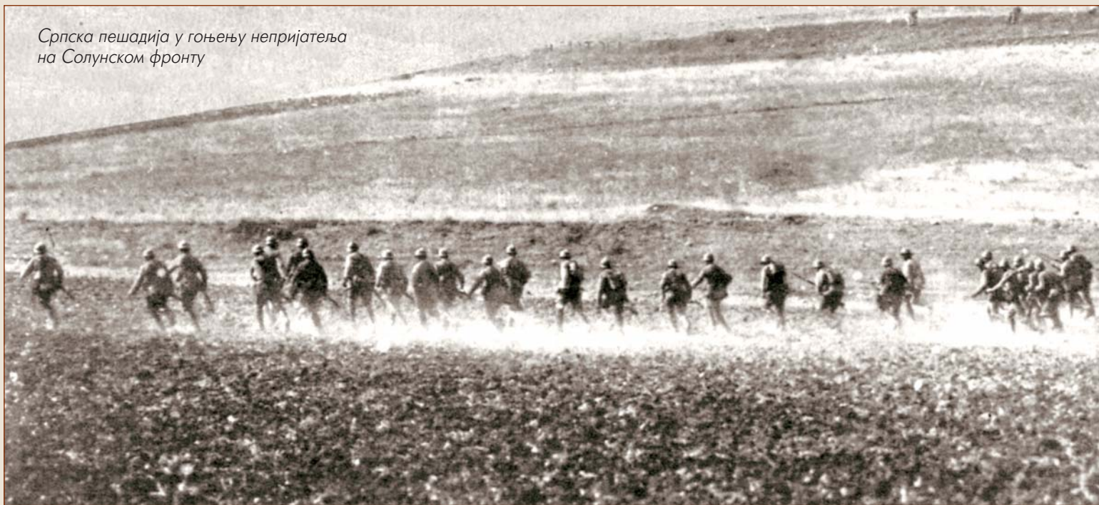
Српска пешадија у гоњењу непријатеља на Солунском фронту

Током првог дана Прва и Трећа армија, изложене дејству артиљерије и митраљеза, напредовале су само неколико стотина метара. По киши и густој магли, карактеристичној за то подручје у том времену, борбе су настављене и следећа два дана, али је 30. октобра, због "немогућих временских услова", прекинута офанзива. Предах је добро дошао за одмор и попуну, јер