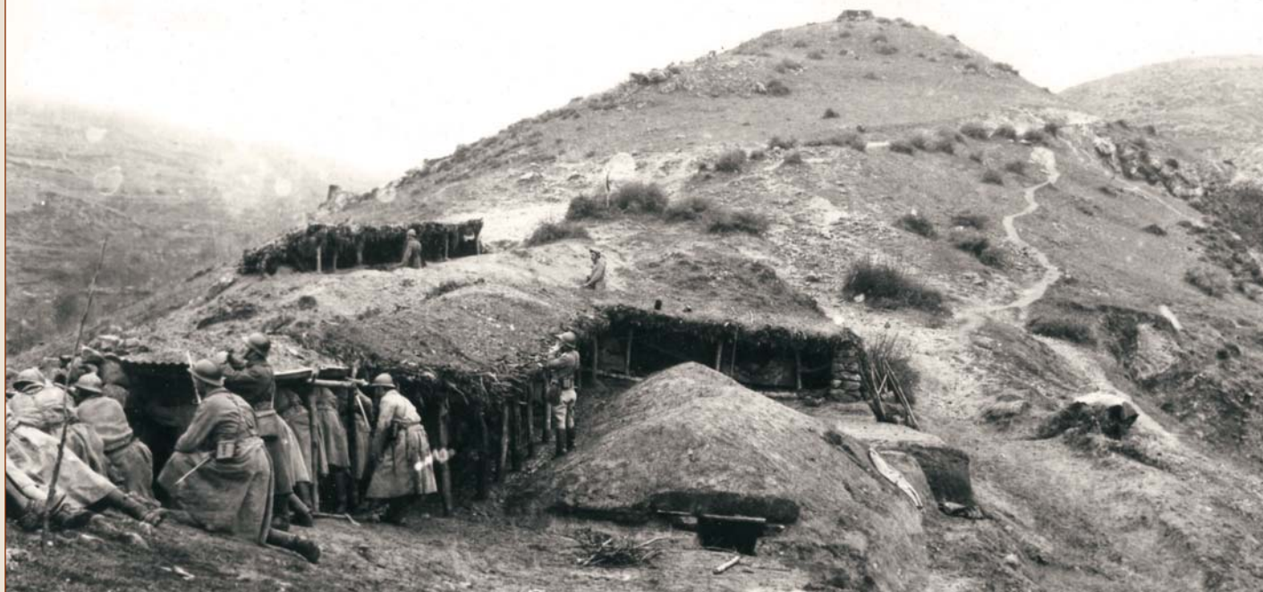
Положај на Солунском фронту 1916.