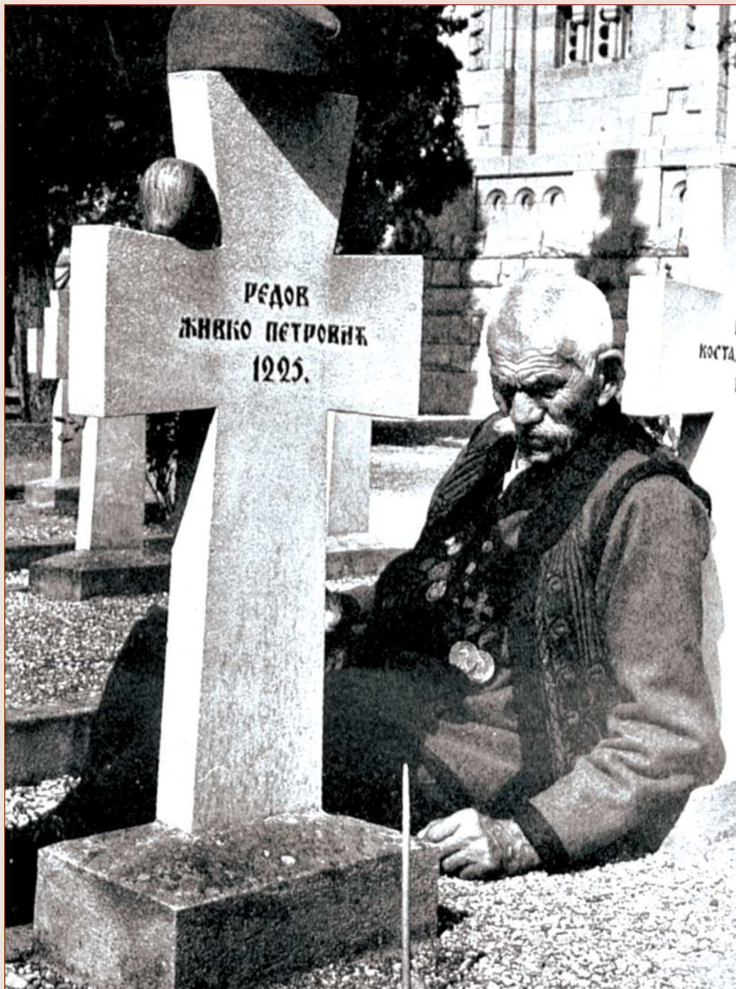
Туга за најмилијим на гробљу Зејтинлик

И данас, 90 година после битке, природа није успела да "поравна" поприште, ни да уклони све трагове које су ратници