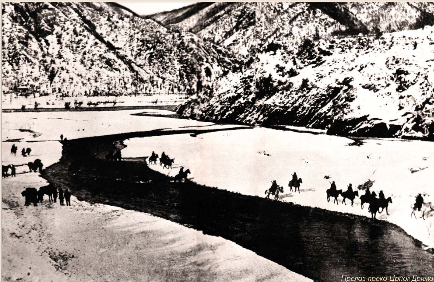
Прелаз преко Црног Дрима