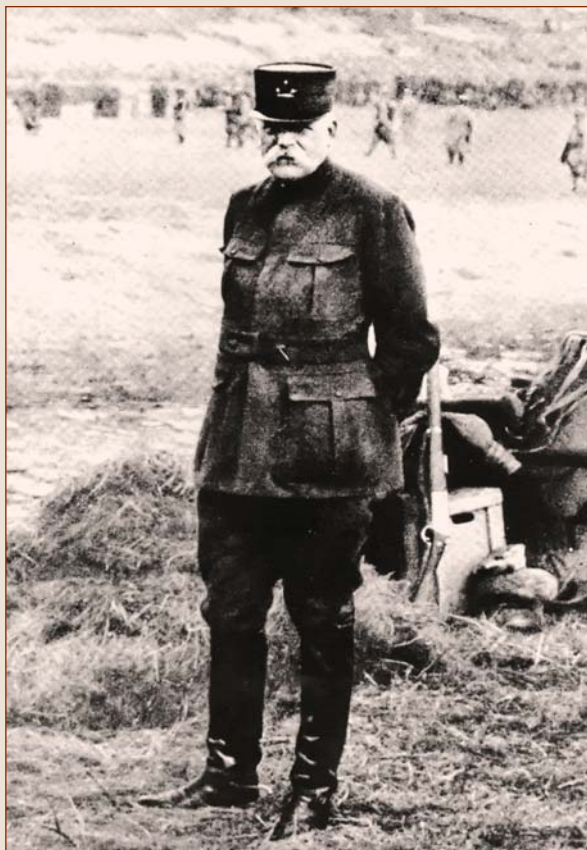
Француски генерал Морис Пол Емануел Сарај је командовао Српском војском у име краља Петра и савезника

После пребацивања српских снага на Халкидику, које је трајало 48 дана, оне су смештене у осам унапред припремљених логора у