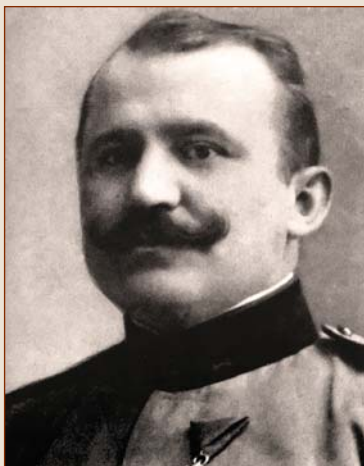
У тешким борбама на Грунишком вису погинуо је Војин Поповић – војвода Вук, командант Добровољачког одреда

Војни историчари и аналитичари закључују да је успех солунске офанзиве до ослобођења Битоља имао различите последице. За Српску војску је то био прави "морални тријумф". Успели су да ослободе 50 км државне територије и наставе рат на свом тлу. Ни за оне који су се налазили иза грчке границе, "туђина није била тако несношљива". Дабоме, савезницима ово није могло значити утеху за губитак Румуније. Протеривањем њене војске на руски простор (реку Серет), престао је да делује и основни мотив за Солунски фронт.