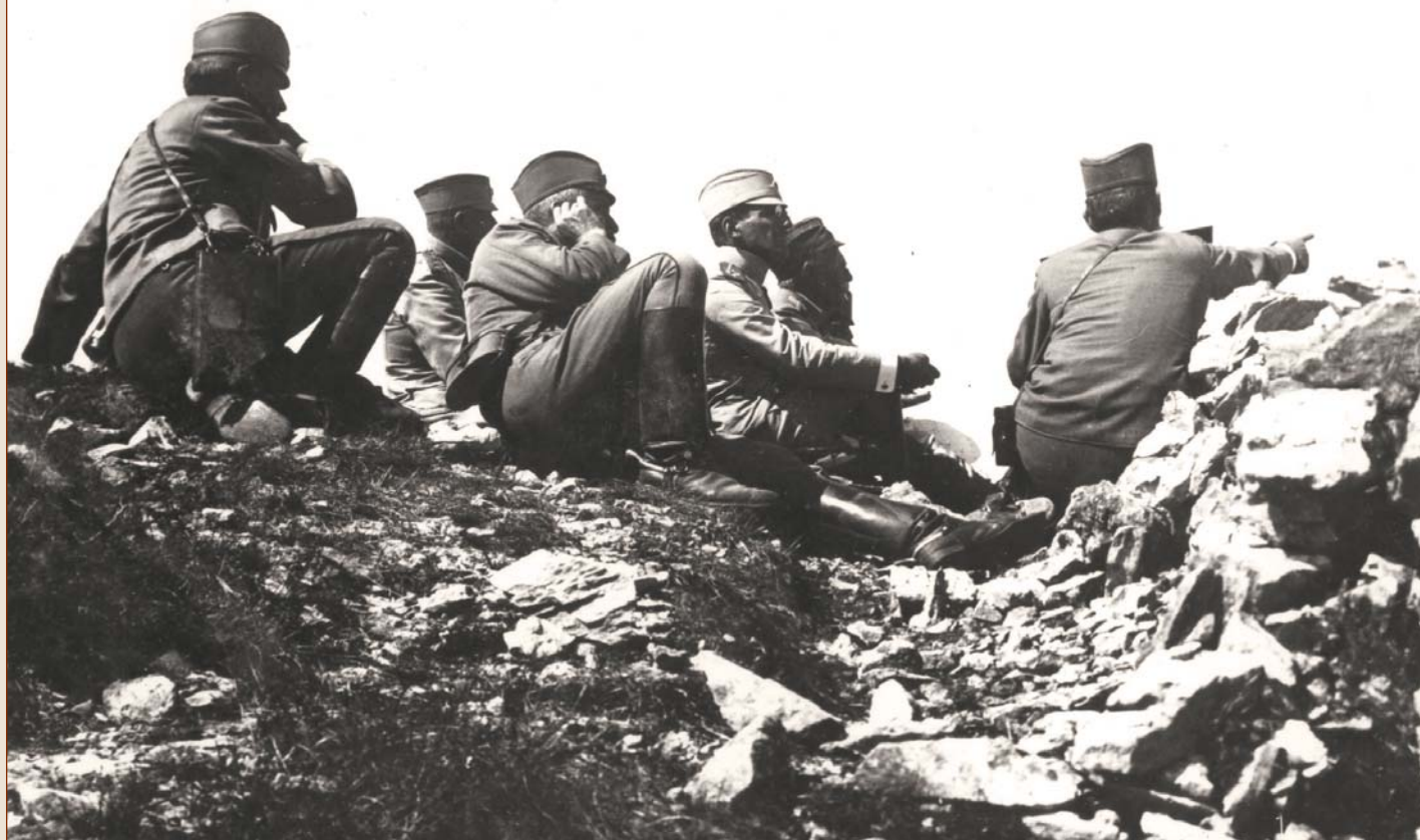
Регент Александар на осматрачници за време битке за освајање Кајмакчалана