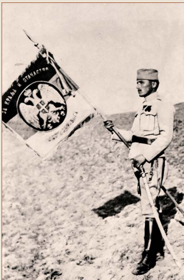
Заставник Другог гвозденог пука

Десетог новембра Српска војска је наставила офанзиву. Дринска дивизија је прешла Белу воду, Дунавска је заузела већи део ровова на "Чукама" и јужни део Полога, а десно кри-