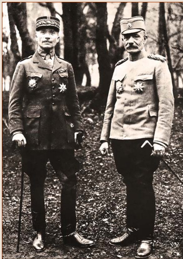
Француски генерал Анри и српски војвода Живојин Мишић

У насталим војно-политичким околностима, Врховна команда Француска наредила је да се из Солуна настави офанзива ради “везивања бугарских снага на грчкој граници”, па је генерал Сарај издао заповест да Српска војска у захвату комуника-